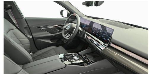
Neuper GmbH - Judenburg - www.neuper.at