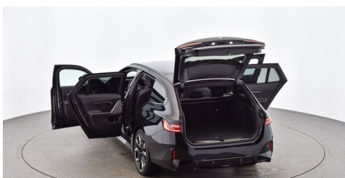
Neuper GmbH - Judenburg - www.neuper.at