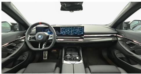
Neuper GmbH - Judenburg - www.neuper.at