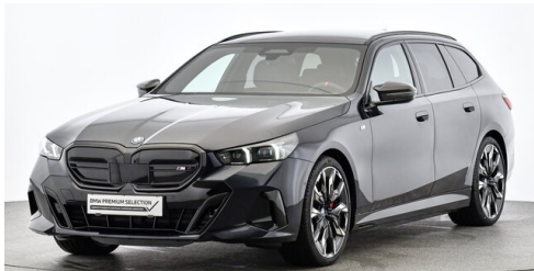
Neuper GmbH - Judenburg - www.neuper.at