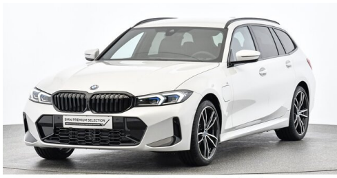
Höglinger Denzel GesmbH - Linz - www.bmw-hoeglinger.at