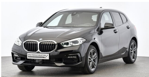
Höglinger Denzel GesmbH - Linz - www.bmw-hoeglinger.at