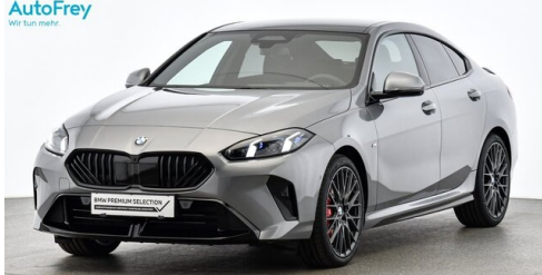
AutoFrey - St.Veit - www.autofrey.at