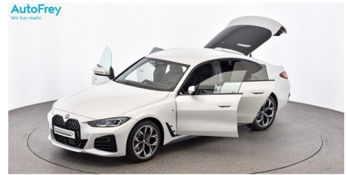
AutoFrey- Salzburg - www.autofrey.at