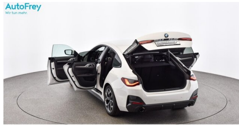
AutoFrey- Salzburg - www.autofrey.at