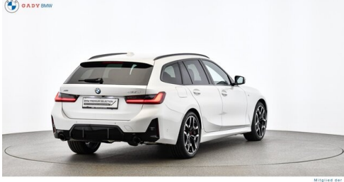
Miplied der GADY Family