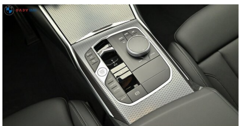
Miplied der GADY Family