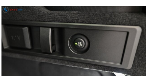
Miplied der GADY Family