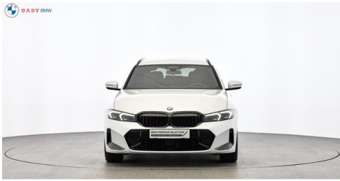
Miplied der GADY Family