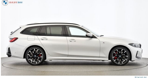
Miplied der GADY Family