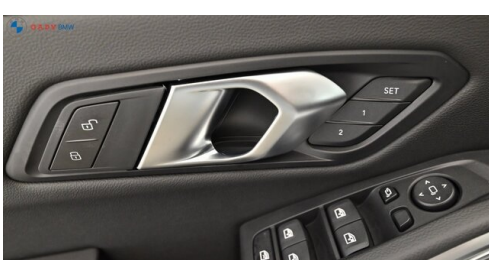
Miplied der GADY Family