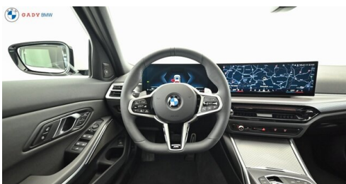
Miplied der GADY Family