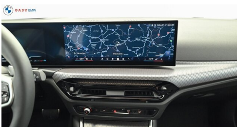
Miplied der GADY Family