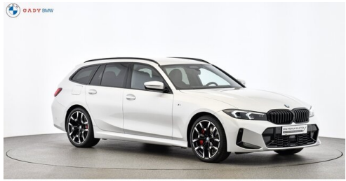
Miplied der GADY Family