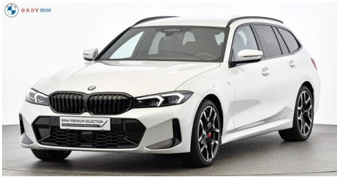
Miplied der GADY Family