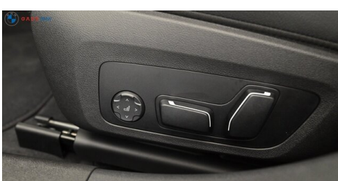
Miplied der GADY Family