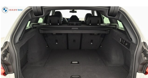
Miplied der GADY Family