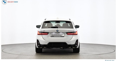
Miplied der GADY Family