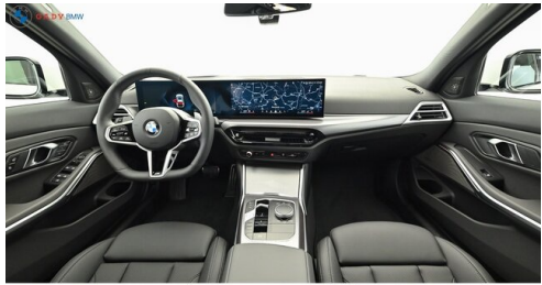
Miplied der GADY Family