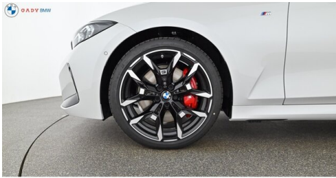
Miplied der GADY Family