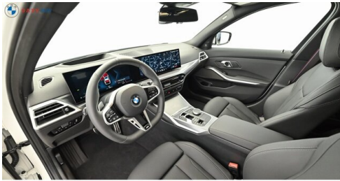
Miplied der GADY Family