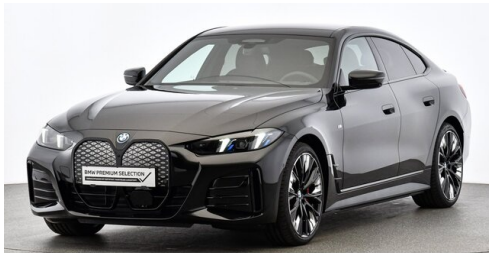
Bierbaum GmbH - Eisenstadt - www.bmw-bierbaum.at