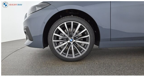
Mittleres der GADY Family