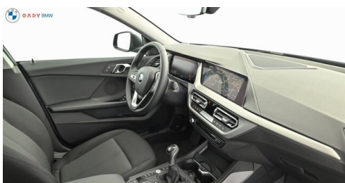
Mittleres der GADY Family