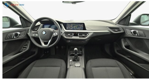
Mittleres der GADY Family