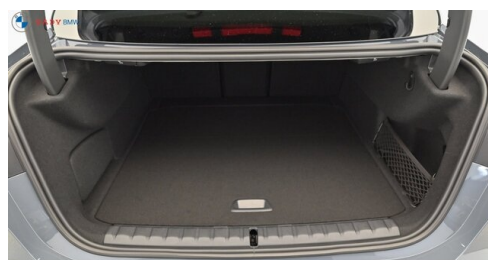
Mittleres der GADY Family