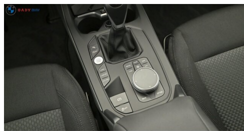
Mittleres der GADY Family