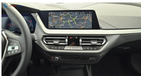
Mittleres der GADY Family