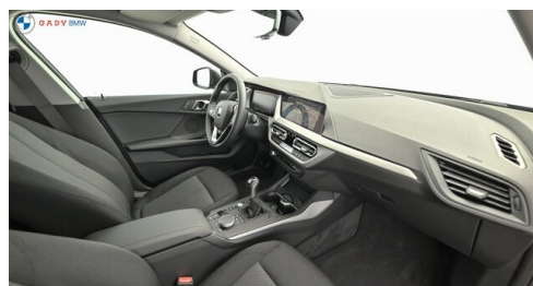
Mittleres der GADY Family