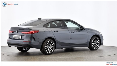
Mittleres der GADY Family