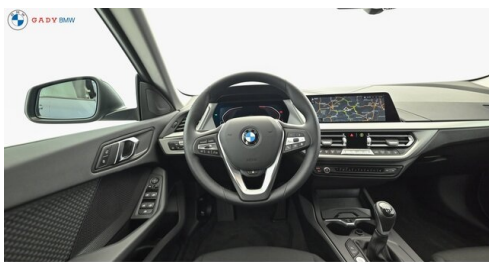
Mittleres der GADY Family