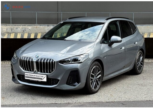
Miglius der GADV Family