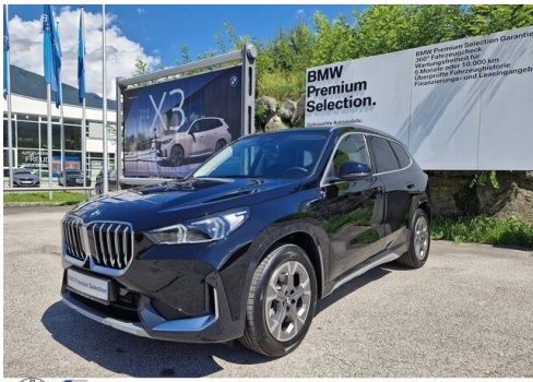
Zorn-Wolf GmbH - Imst - www.zorn-wolf.bmw.at 05412 / 63518