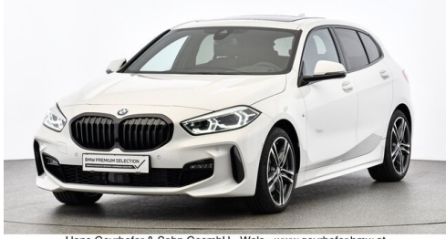
Hans Geyrhofer & Sohn GesmbH - Wels - www.geyrhofer.bmw.at