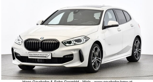
Hans Geyrhofer & Sohn GesmbH - Wels - www.geyrhofer.bmw.at