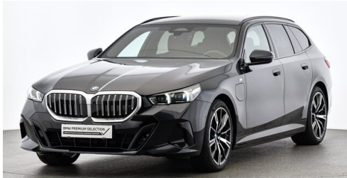
Bierbaum GmbH - Eisenstadt - www.bmw-bierbaum.at