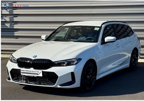
Migliore del G A D V Family