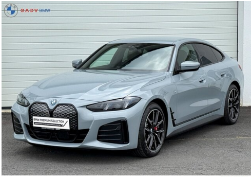
Модель от GADY Family