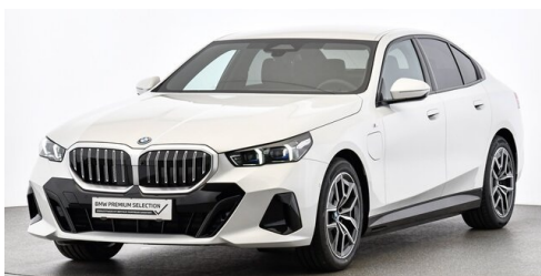
Höglinger Denzel GesmbH - Linz - www.bmw-hoeglinger.at