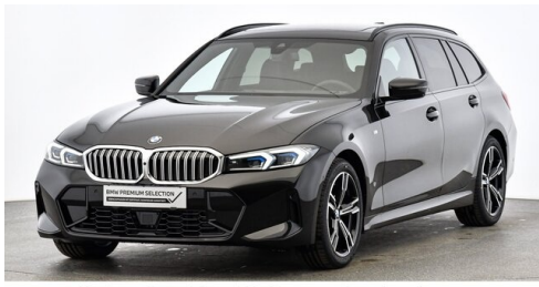
Höglinger Denzel GesmbH - Linz - www.bmw-hoeglinger.at