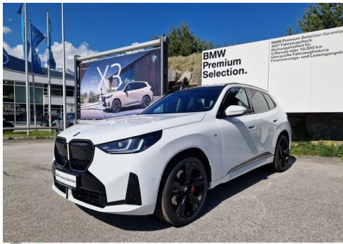
Zorn-Wolf GmbH - Imst - www.zorn-wolf.bmw.at 05412 / 63518