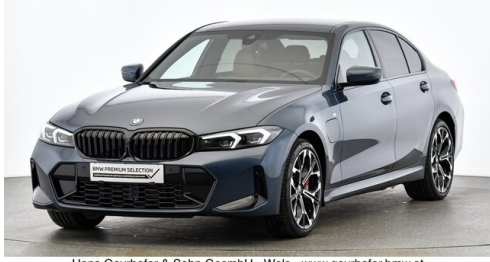
Hans Geyrhofer & Sohn GesmbH - Wels - www.geyrhofer.bmw.at