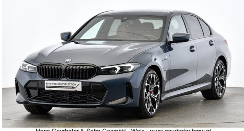
Hans Geyrhofer & Sohn GesmbH - Wels - www.geyrhofer.bmw.at