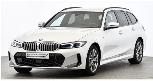
Höglinger Denzel GesmbH - Linz - www.bmw-hoeglinger.at