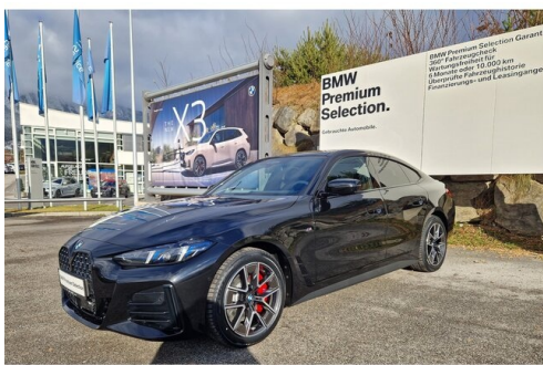
Zorn-Wolf GmbH - Imst - www.zorn-wolf.bmw.at 05412 / 63518