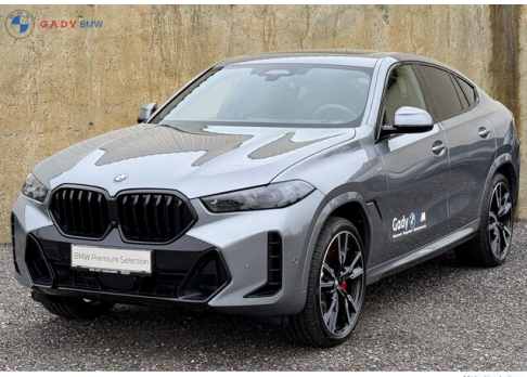
Mi glos car GADY Family