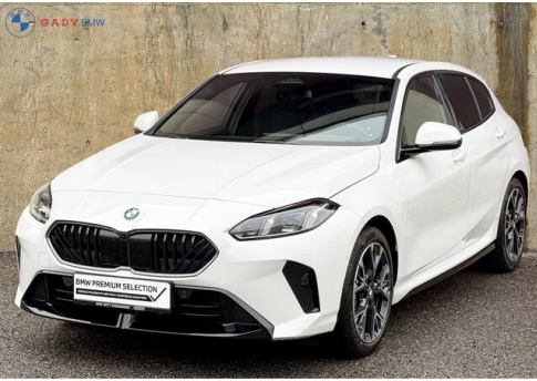
Migliors der GADY Family