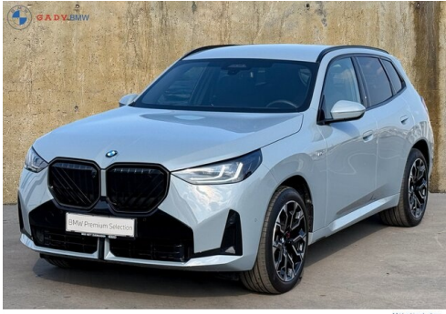
Mitglied der GADV Family