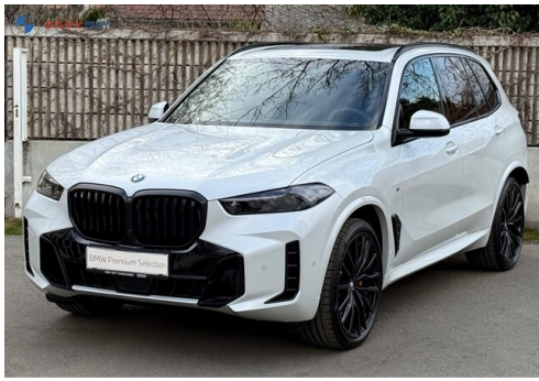
Milgros dar GADV Family