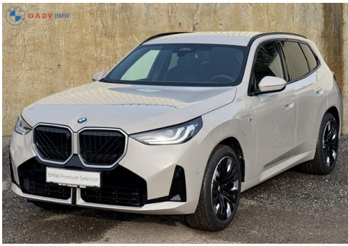
Migros der GADY Family