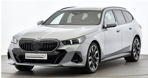
Hans Geyrhofer & Sohn GesmbH - Wels - www.geyrhofer.bmw.at