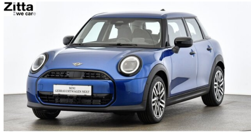
Zitta Betriebs GmbH - Perchtoldsdorf - www.zitta.at