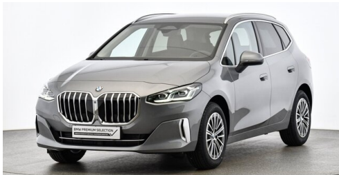
Höglinger Denzel GesmbH - Linz - www.bmw-hoeglinger.at