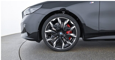
Autohaus Innerbichler GmbH - Ramsau im Zillertal - www.innerbichler.bmw.at