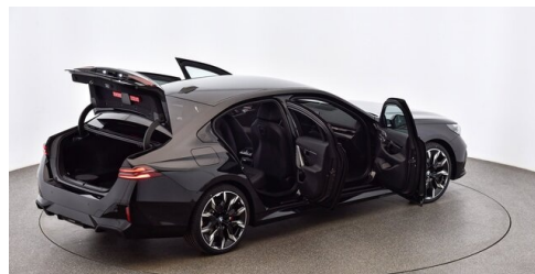
Autohaus Innerbichler GmbH - Ramsau im Zillertal - www.innerbichler.bmw.at