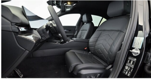
Autohaus Innerbichler GmbH - Ramsau im Zillertal - www.innerbichler.bmw.at