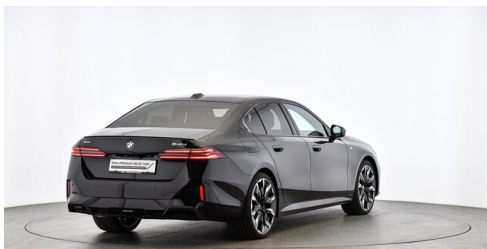
Autohaus Innerbichler GmbH - Ramsau im Zillertal - www.innerbichler.bmw.at