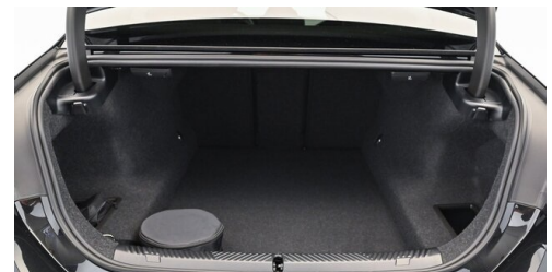
Autohaus Innerbichler GmbH - Ramsau im Zillertal - www.innerbichler.bmw.at