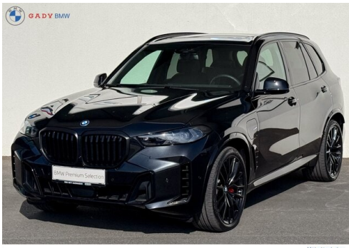
Mitglieds der GADY Family