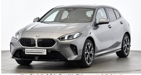
Hans Geyrhofer & Sohn GesmbH - Wels - www.geyrhofer.bmw.at