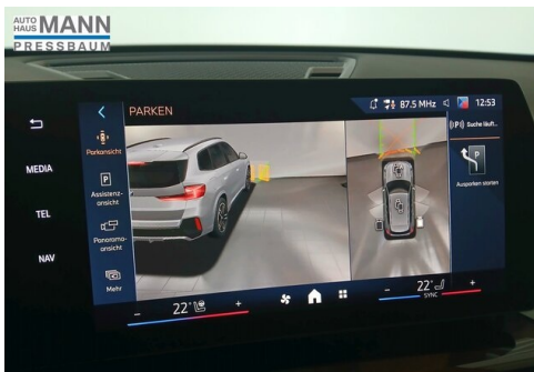
AUTOHAUS JOSEF MANN - PRESSBAUM - WWW.MANN.BMW.AT