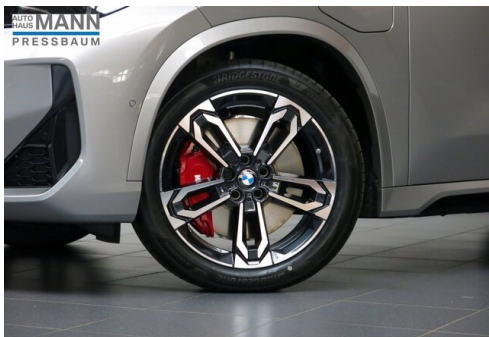
AUTOHAUS JOSEF MANN - PRESSBAUM - WWW.MANN.BMW.AT