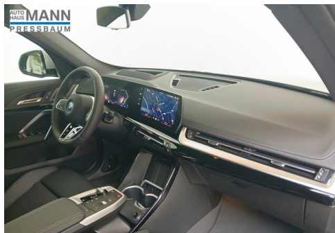
AUTOHAUS JOSEF MANN - PRESSBAUM - WWW.MANN.BMW.AT