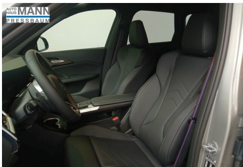
AUTOHAUS JOSEF MANN - PRESSBAUM - WWW.MANN.BMW.AT