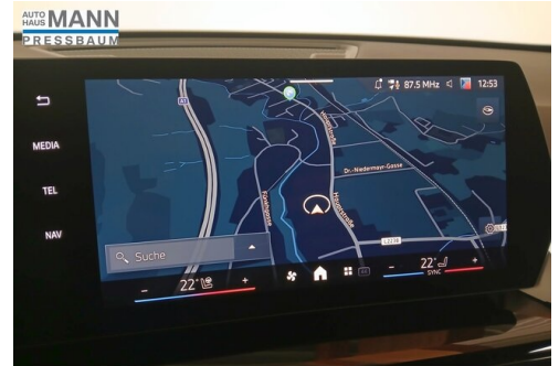
AUTOHAUS JOSEF MANN - PRESSBAUM - WWW.MANN.BMW.AT