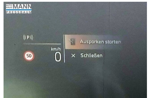
AUTOHAUS JOSEF MANN - PRESSBAUM - WWW.MANN.BMW.AT