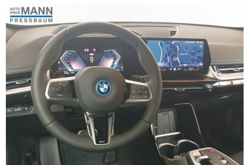
AUTOHAUS JOSEF MANN - PRESSBAUM - WWW.MANN.BMW.AT