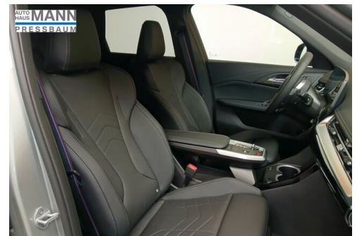
AUTOHAUS JOSEF MANN - PRESSBAUM - WWW.MANN.BMW.AT