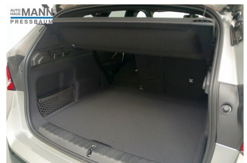
AUTOHAUS JOSEF MANN - PRESSBAUM - WWW.MANN.BMW.AT