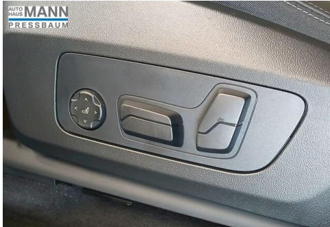
AUTOHAUS JOSEF MANN - PRESSBAUM - WWW.MANN.BMW.AT