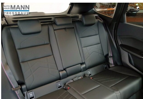
AUTOHAUS JOSEF MANN - PRESSBAUM - WWW.MANN.BMW.AT