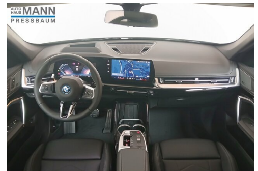
AUTOHAUS JOSEF MANN - PRESSBAUM - WWW.MANN.BMW.AT