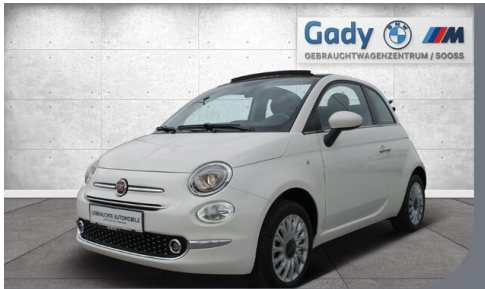
GADY Family bewegt. Steiermark • Burgenland • Niederösterreich