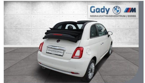
GADY Family bewegt. Steiermark • Burgenland • Niederösterreich