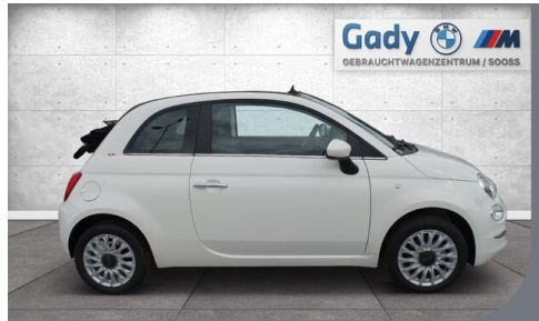
GADY Family bewegt. Steiermark • Burgenland • Niederösterreich