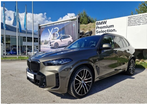
Zorn-Wolf GmbH - Imst - www.zorn-wolf.bmw.at 05412 / 63518