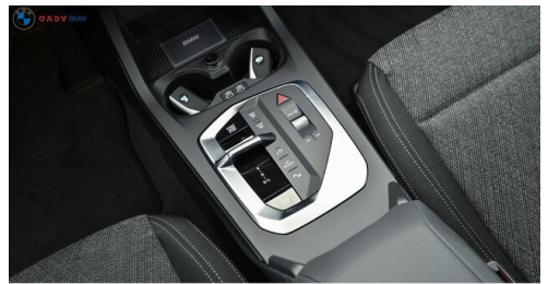
Modelo de GADY Family