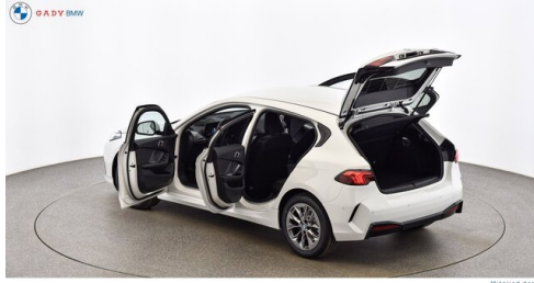
Modelo de GADY Family