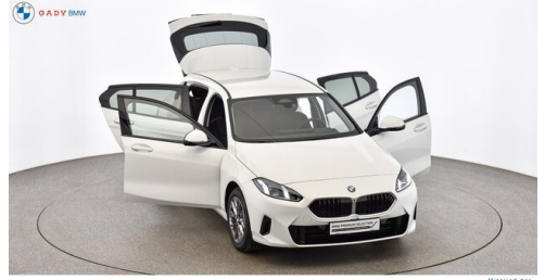
Modelo de GADY Family