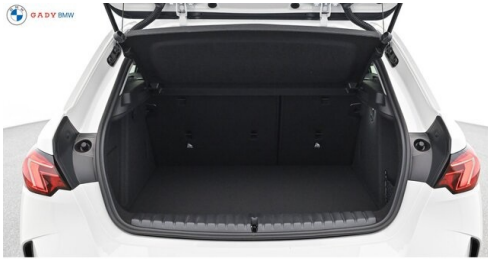
Modelo de GADY Family