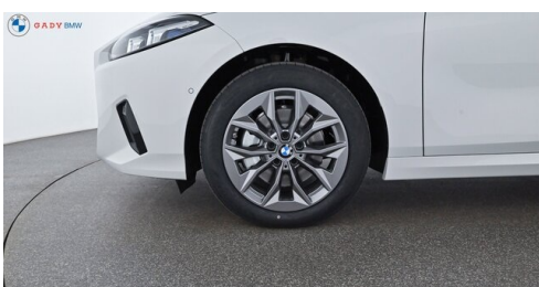
Modelo de GADY Family