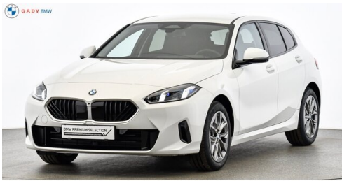
Modelo de GADY Family