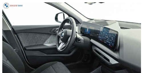
Modelo de GADY Family