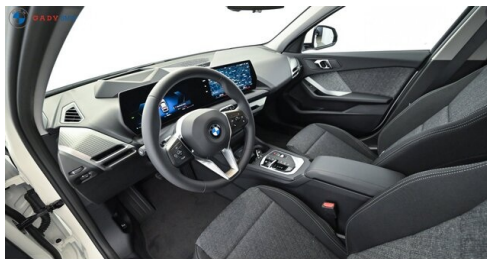
Modelo de GADY Family