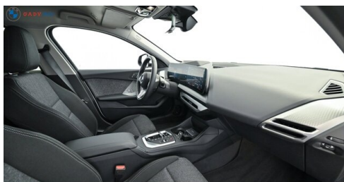
Modelo de GADY Family