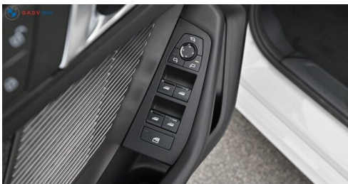
Modelo de GADY Family