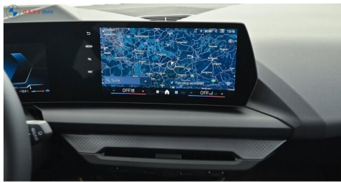
Modelo de GADY Family