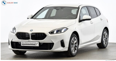
Modelo de GADY Family