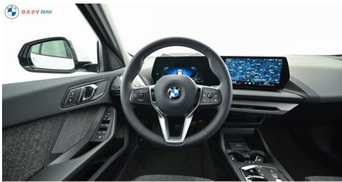
Modelo de GADY Family