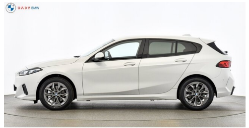
Modelo de GADY Family