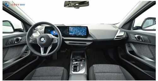
Modelo de GADY Family