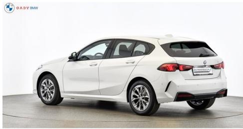
Modelo de GADY Family