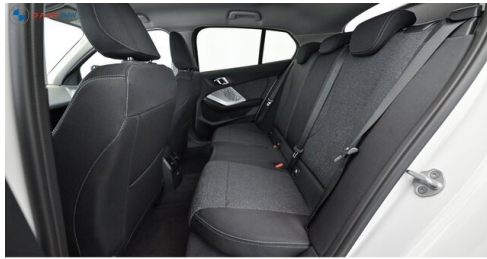
Modelo de GADY Family